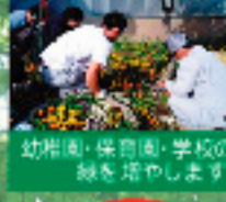
幼稚園・保育園・学校の緑を育てます!