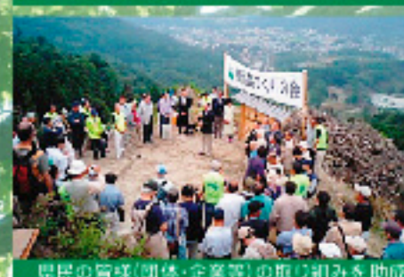
県民の皆(団体・企業等)の取り組みを助成