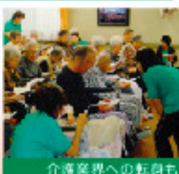
介護業界への転身も