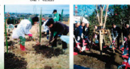
緑の少ない地区で、公園等に新たな森づくり!

710万県民一人一本の植樹を目指して、今年度も引き続き諸事業が行われます。公園や学校など、行政が管理する施設ではもちろんのこと、企業・団体が取り組む植樹にも、県が積極的な支援を行います!また、皆様が植樹に取り組まれた際には、ぜひ「エントリー制度」に登録してください!!