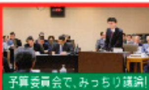
予算委員会で、みっちり議論!

2月定例会では、政権交代に伴う国の大事業も県の予算審議を通じて議題に上りました。マニフェストにこだわるあまり、見切り発車をした感が否めません。皆様からも、ぜひご意見をお寄せいただければ幸いです!!