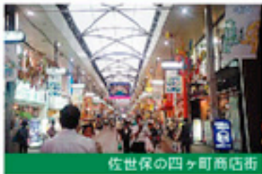
佐世保の四ヶ町商店街