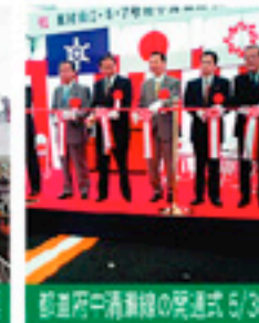
都道府県新幹線の発通式 5/30