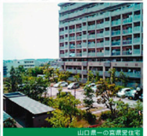
山口県一の宮県営住宅