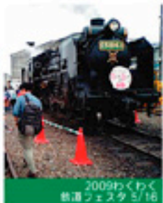
2009わくわく鉄道フェスタ 5/16