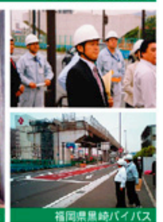
福岡県黒崎バイパス