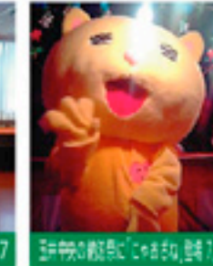
研究所の観覧に参加 8/31