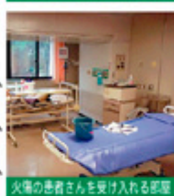
火傷の患者さんを受け入れる部屋