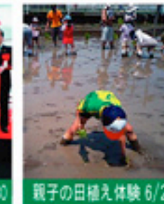
親子の田植え体験 6/27