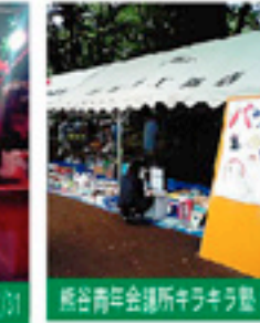
熊谷青年会議所キラキラ祭 8/1