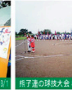
熊子達の球技大会 8/1