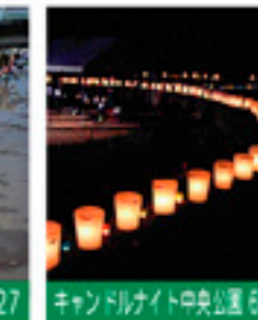
キャンドルナイト中央公園 6/27