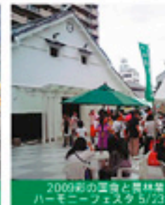
2009朝の運動と森林祭 ハーモニーフェスタ 5/23