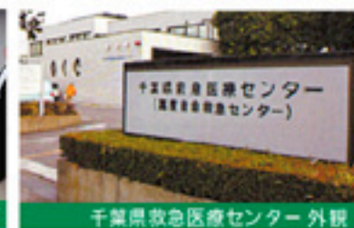
千葉県救急医療センター 外観