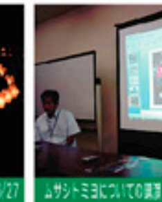
ムサトミについての説明 7/11