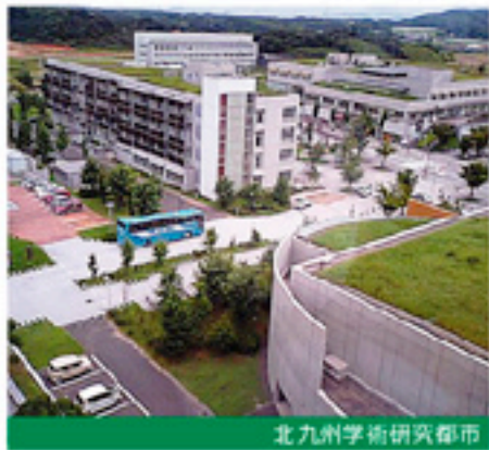
北九州学術研究都市