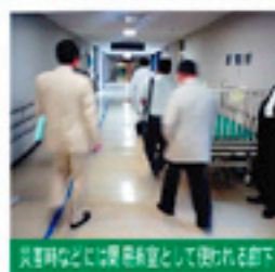
災害時などに災害拠点として使われる部

ここを活かす!! 患者さんの「たらい回し」を根絶するためにも、救急医療の充実が求められています。救急専門の医療機関は、県民の皆さんの大きな信頼につながりますね！お医者さんにとっては、ここで働くことにより救急医療の経験を積めるというメリットもあり、医師の確保も順調なようです。