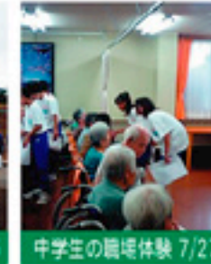
中学生の職場体験 7/27