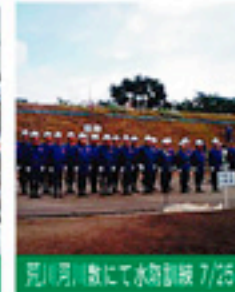
荒川河川敷にて水筒祭 7/25