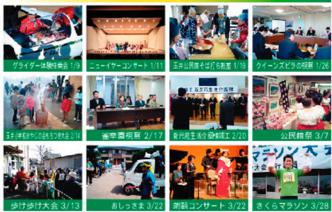
グライダー体験乗会 1/9 | ニューイヤーコンサート 1/11 | 玉井公民館そば打ち教室 1/18 | クイーンズピラの視察 1/26 | 玉井小学校やしの会50周年大会 2/14 | 雀幸園視察 2/17 | 新光苑生活介護福祉工 2/20 | 公民館祭 3/7 | 歩け歩け大会 3/13 | おしっさま 3/22 | 朗読コンサート 3/22 | さくらマラソン 3/28