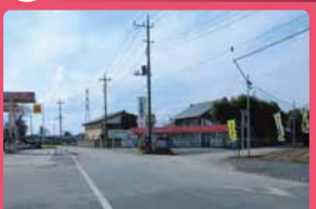
歩道整備で安全に