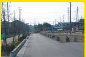
県道整備への負担金