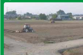
耕作しやすい農地へ