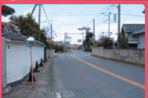
歩道整備で安全に