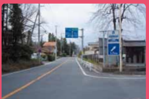
歩道整備で安全に