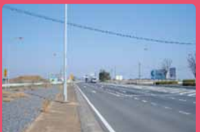
国道17号バイパス～4車線化