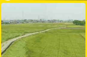
耕作しやすい農地へ