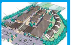
平成25年度開校予定