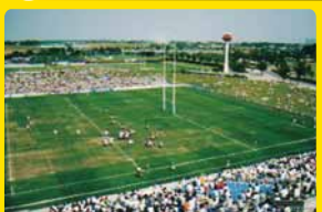
ラグビー場の補修など