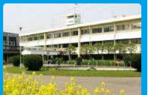
熱さに強い品種研究