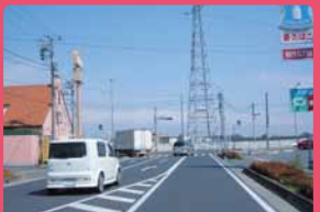
ローソン前～国道407号へ