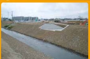
安全・安心の川へ