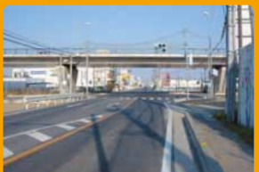
歩道整備で安全に