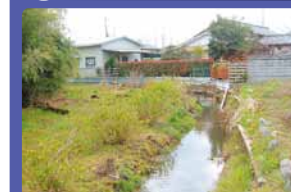
親しみやすい水辺を創出