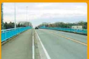
耐震工事で安全に