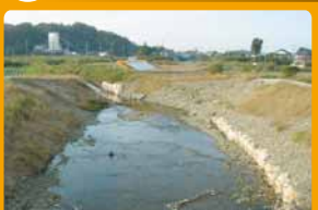
川のバイパス工事進行中