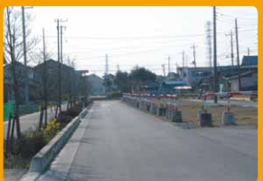
県道整備への負担金