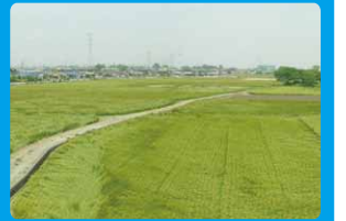
耕作しやすい農地へ