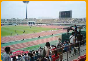
陸上競技場の改修