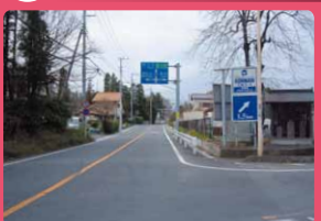
歩道整備で安全に