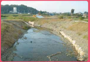
川のバイパス工事