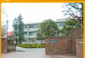
乳製品製造機器の設置