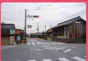
歩道整備で安全に