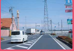
ローソン前～国道407号へ