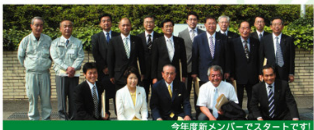
今年度新メンバーでスタートです!