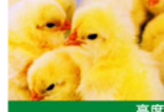
高度な品質管理が求められます