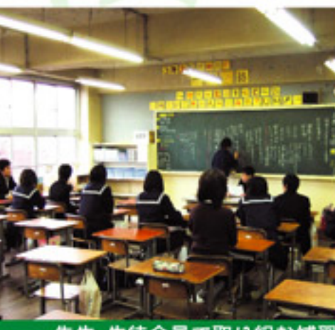
先生・生徒全員で取り組む補習