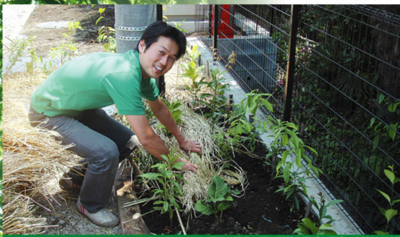
熊谷の植生に近い樹種を選び、混植、密植します!!