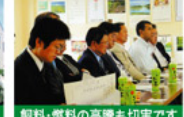
飼料・燃料の高騰も切実です