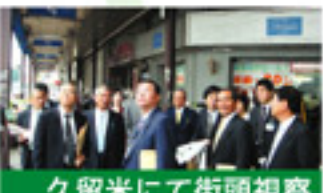
久留米にて街頭視察