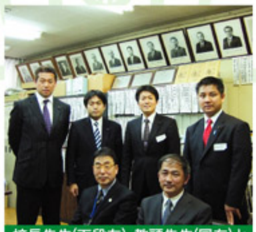
校長先生(下段左)・教頭先生(同右)と