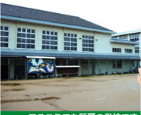
マスコミでも話題の学校です