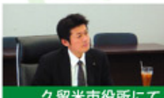
久留米市役所にて